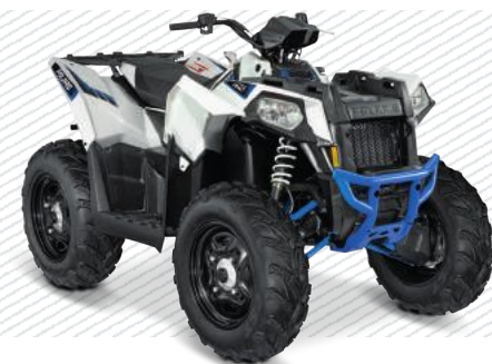
White Lightning A165VT95C2