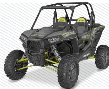
Titanium Matte Metallic Z16VDE99FM

Dzięki podwójnym wahaczom poprzecznym z tyłu i z przodu o skoku 22,9 i 24cm, RZR 570 gwarantuje kierowcy oraz pasażerowi najwyższą wygodę nawet w najtrudniejszym terenie.