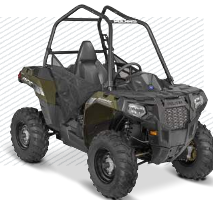
Sage Green A15DA457N1