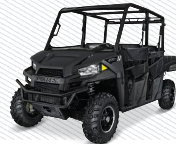
Titanium Matte Metallic R16RNE57AH