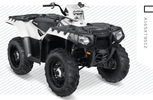
White Lightning A165X195C2