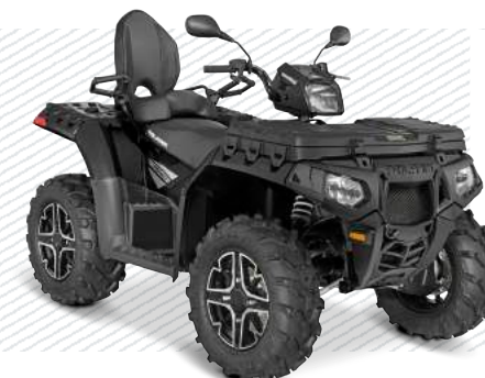
Black Pearl A165Y95CCK