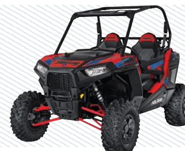
Havas Red Pearl Z16VFE99AM