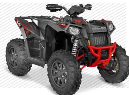
Titanium Matte Metallic A165VS95CM