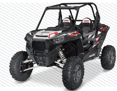
Graphite Crystal Z16VDE92AHE