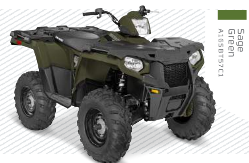
Sage Green A165B157C1