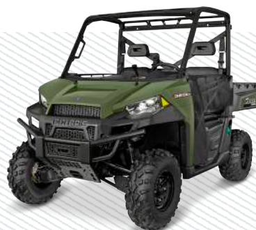
Sage Green R16RTE01F1