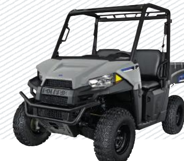
Avalanche Grey R16RMAE01B