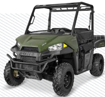
Sage Green R16RTE01F1