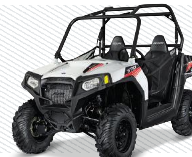
White Lightning Z16VHA57BJT