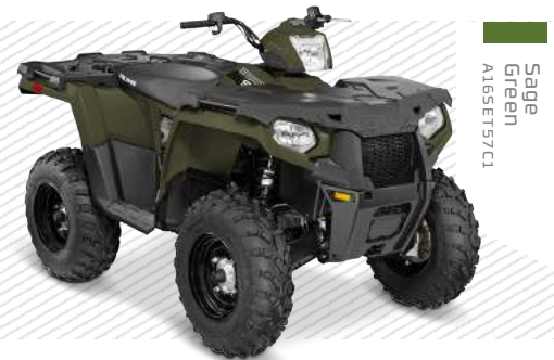
Sage Green A165E157C1