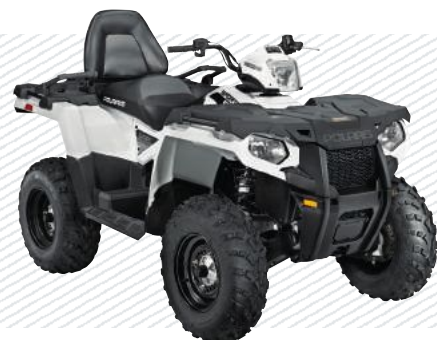
Bright White A1650557C2