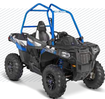
Titanium Matte Metallic A15DA657NM