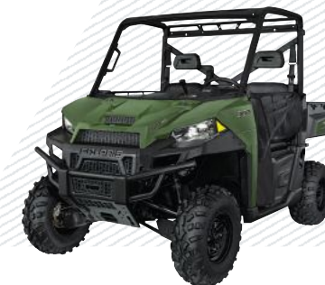
Sage Green R16RTE01F1