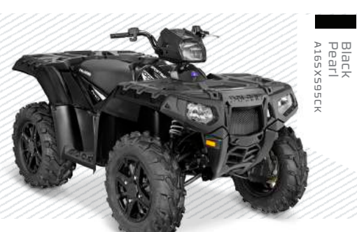
Black Pearl A165X595C1