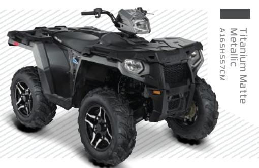
Titanium Matte Metallic A165H557C1