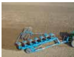
Półzawieszane pługi obracalne