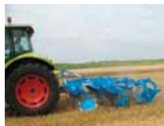
Krótkie bronie talerzowe