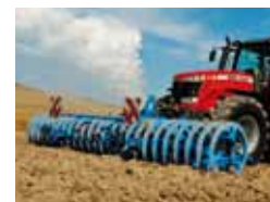
Wały uprawowe ciągane