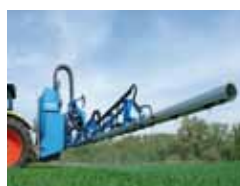
Opryskiwacze polowe - zawieszane