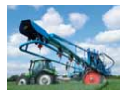
Opryskiwacze polowe - ciągane

LEMKEN GmbH & Co. KG Weseler Straße 5 D-46519 Alpen Telefon +49 2802 81 0 Telefax +49 2802 81 220 lemken@lemken.com www.lemken.com