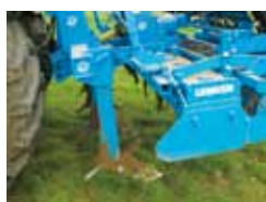
Spulchniacze śladów oraz głębsze