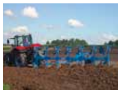
Hybrydowe pługi obracalne