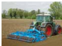
Bierne agregaty uprawowe