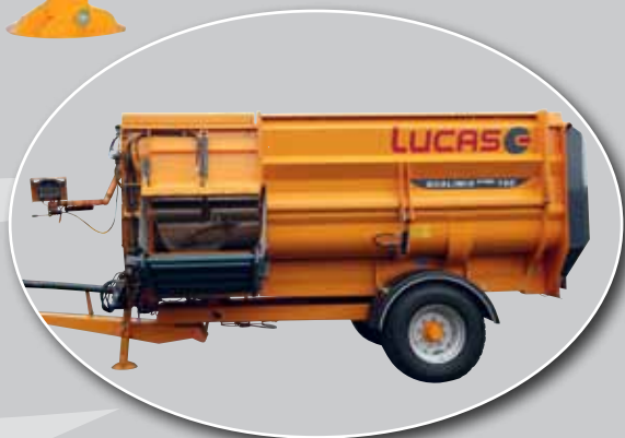
QUALIMIX® 150 dla małych zwierząt przeżuwających