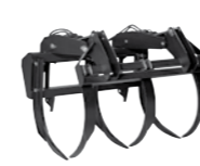
CHWYTAK DO TRZCINY