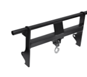
HAK DO PODNOSZENIA