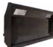
LEMIEZ DO KISZONKI