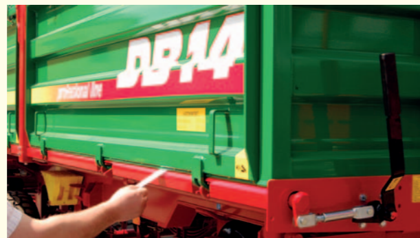
Przyczepy DB charakteryzuje gwarantowana szczelność wykonania nadwozia.