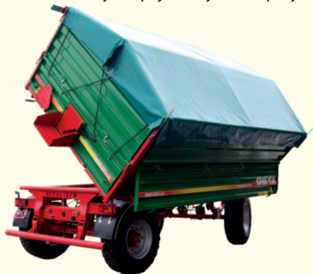
Trójstronny wywrot skrzyni ładunkowej daje pełną funkcjonalność wykorzystania przyczepy.

Klientom dajemy możliwość dostosowania przyczepy do indywidualnych potrzeb, dzięki szerokiemu wyposażeniu dodatkowemu i różnym opcjom wykonań przyczepy.