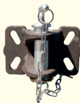
Przyczepy serii DB oraz DBL można wyposażyć w zaczepy o różnej sile uciągu. Przy ich doborze należy zwrócić uwagę na możliwości techniczne zaczepu. Siła uciągu jest zależna od mas sprzęgniętych przyczep.