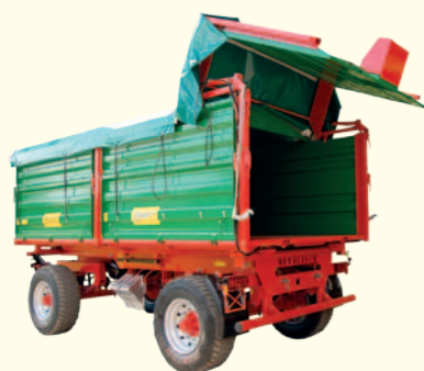
Hydraulicznie unoszona ściana tylna chętnie stosowana przy wykorzystaniu przyczepy do przewozu i rozładunku zielonek czy okopowych.