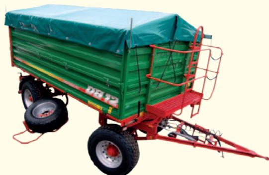
NOWOŚĆ. Obrotowy kosz koła zapasowego. Rozwiązanie opatentowane przez ZM Metaltech.