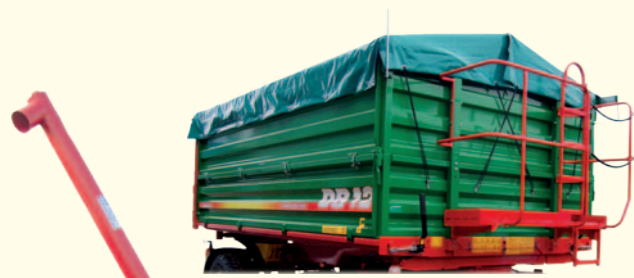
Stelaż z plandeką i bezpiecznym pomostem dla operatora.