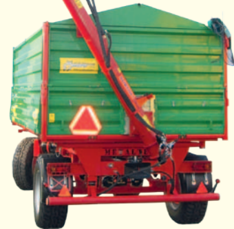
Okno do rozładunku strumieniowego przystosowane jest do mocowania przenośnika ślimakowego.