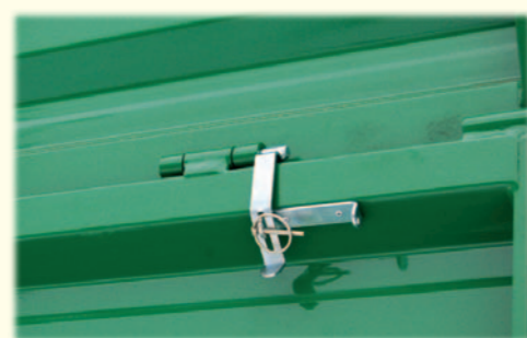
Szybki demontaż górnej burty jest możliwy dzięki zastosowaniu łatwego do demontażu sworznia zawiasu.