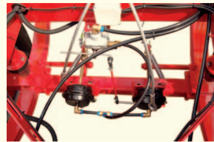
Hamulce przyczep kontrolowane są przez układ automatycznej regulacji siły hamowania oparty na siłownikach membranowych. Przyłączanie do ciągnika poprzez wygodne przewody skrętne.