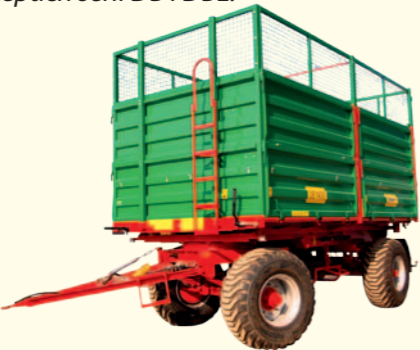
Do przewozu pasz objętościowych przyczepy można wyposażyć w nadstawy siatkowe.