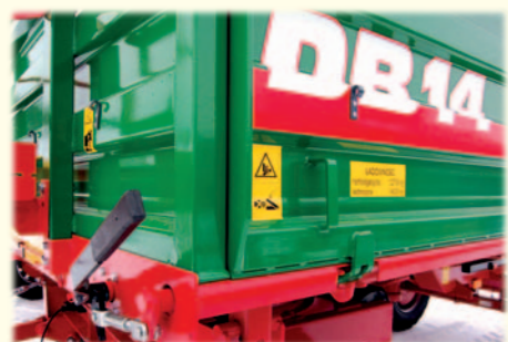
Otwieranie dolnej burty według górnego punktu obrotowego odbywa się poprzez pociągnięcie jednej dźwigni zamka centralnego ręcznie lub poprzez siłownik hydrauliczny.