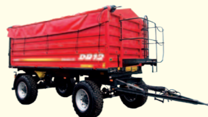
Przyczepy mogą być lakierowane na zamówienie klienta w kolorach przez niego wskazanych w zamówieniu np. dostosowanych do koloru ciągnika.

Standardowe wyposażenie przyczep DB: wykonanie skrzyni ładunkowej z gwarancją szczelności na rzepak, profile burtowe niemieckiej firmy BOWA, dwuobwodowe hamulce pneumatyczne z automatyczną regulacją siły hamowania, hamulec ręczny, resory paraboliczne, klipy podporowe, błotniki na kołach tylnych, elektryczna instalacja oświetleniowa, centralne zamki burt, okno wraz z rynną w tylnej burcie do rozładunku strumieniowego, drabina, 2 stopnie w skrzyni ładunkowej, zawór odcinający automatycznie hydraulikę przy maksymalnym kącie wywrotu przyczepy, wyprowadzenie wszystkich instalacji do podłączenia drugiej przyczepy. Lakierowanie standardowe: ramy – czerwone, burty – zielone.