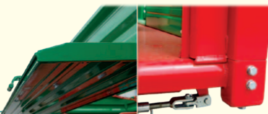
Uszczelnienie prętem stalowym oraz pionowe uszczelnienie pasowane ręcznie zapewniają wyjątkową szczelność na materiały sypkie, takie jak rzepak.